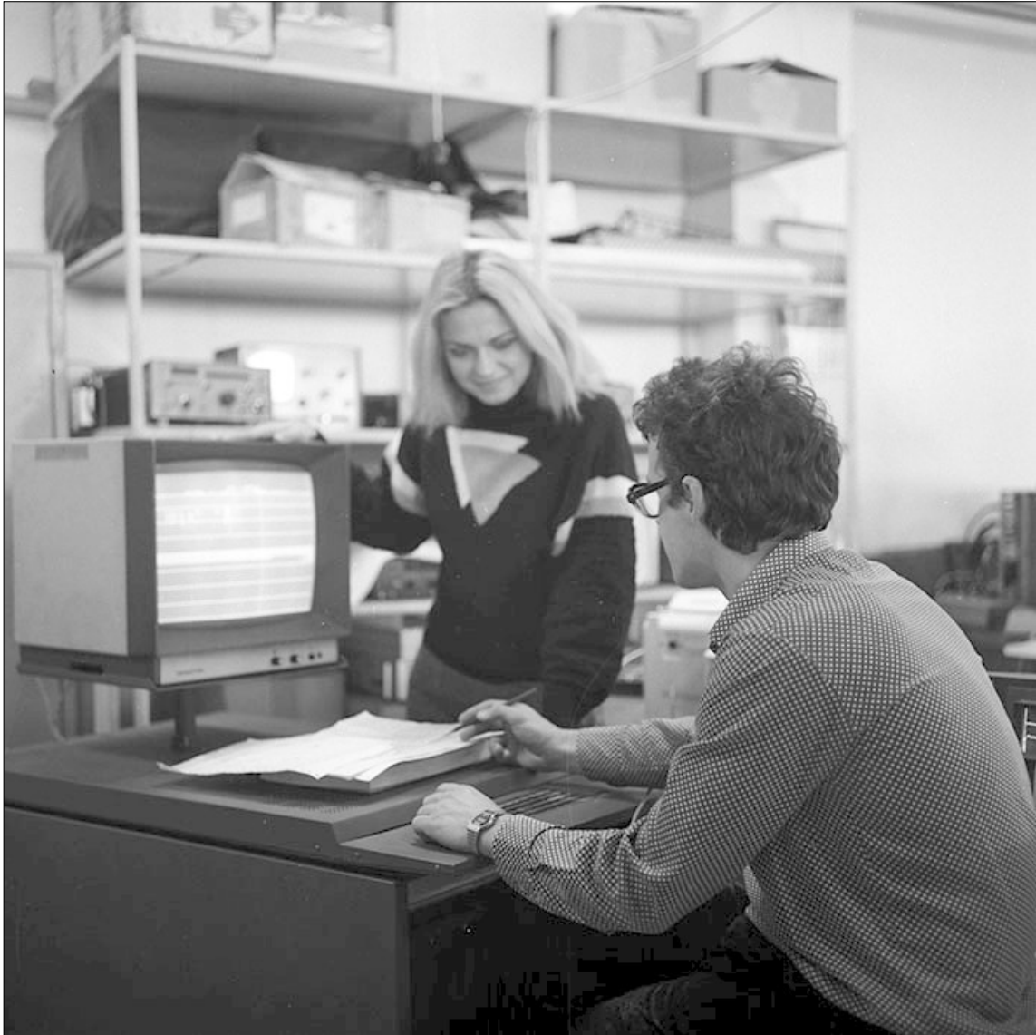
IEIA. Kolozsvár, 1987.