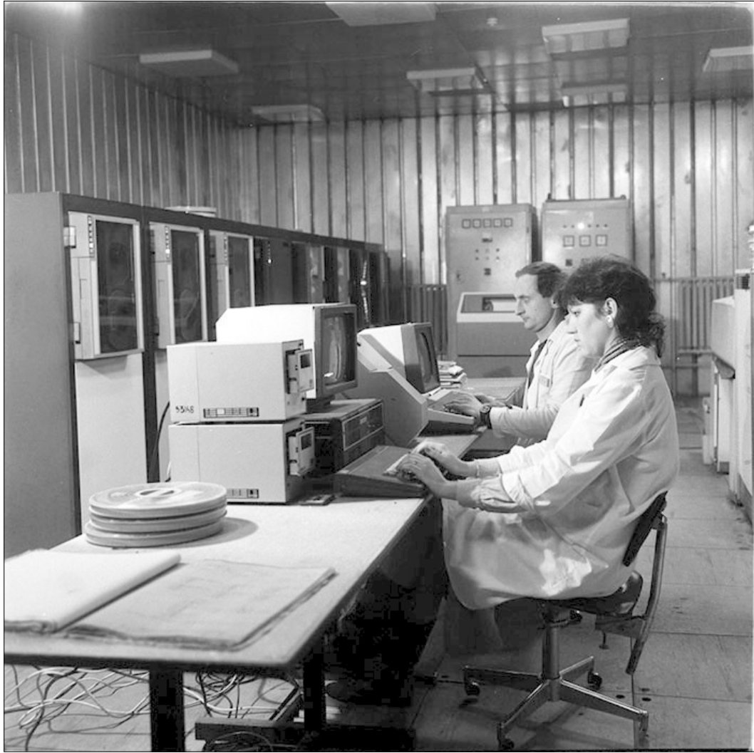
Tehnofrig. Kolozsvár, 1987.