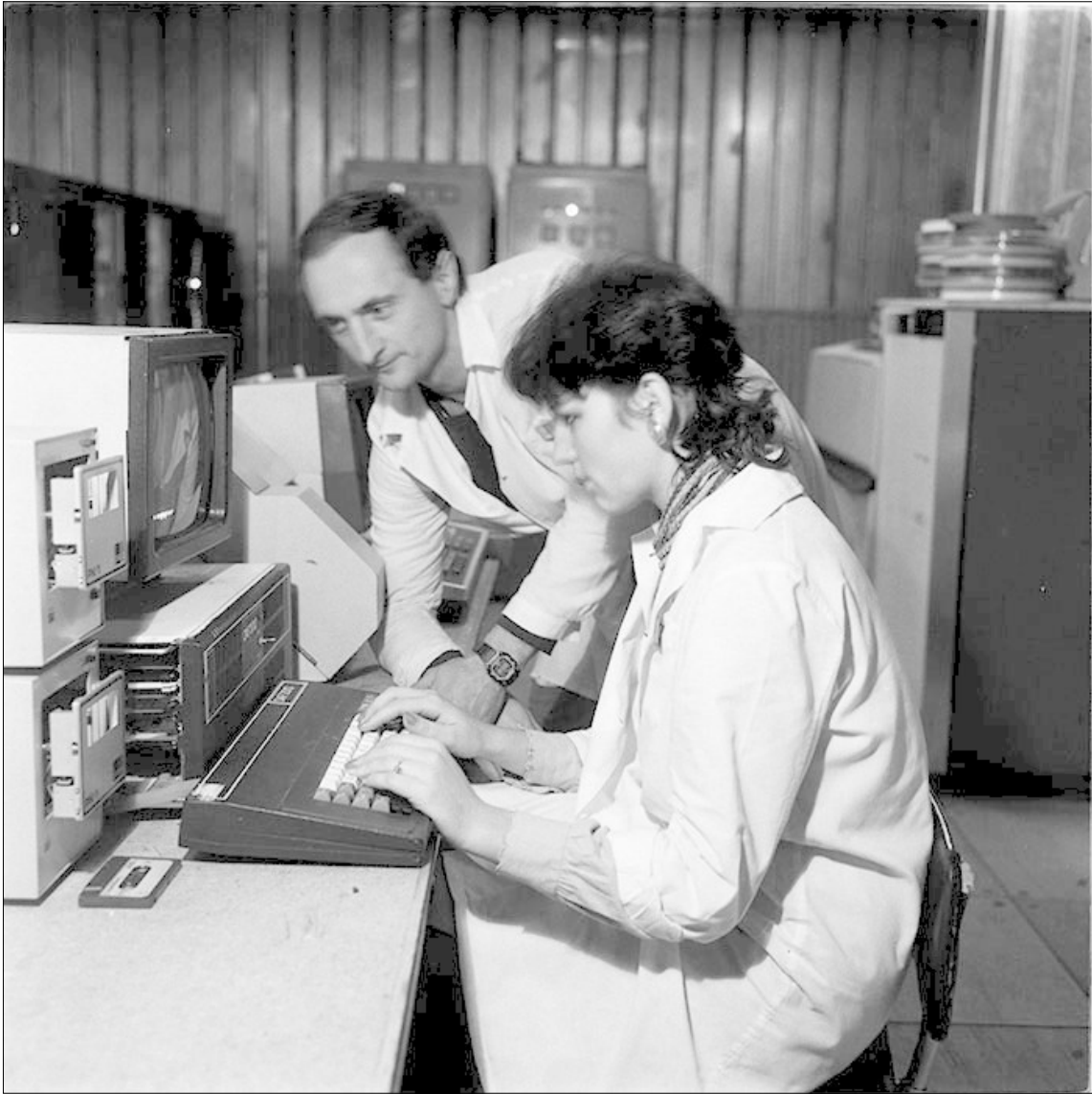
Tehnofrig. Kolozsvár, 1987.