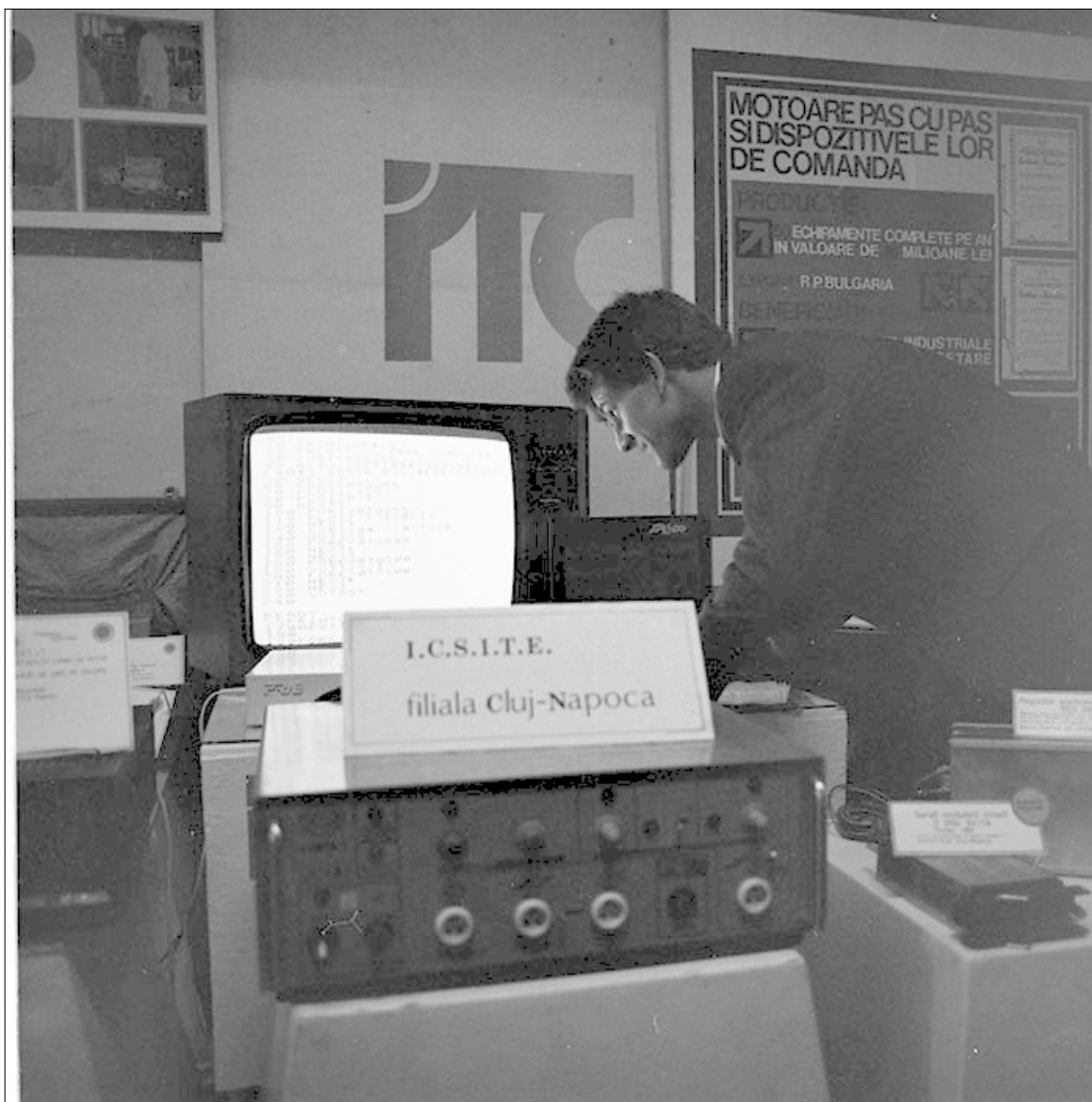
Kiállítás, 1984, faliújság.

3 Ezzel a szóhasználattal – „technischen Bilder” – él Vilém Flusser Für Eine Philosophie der Fotografie című munkájában. (Göttingen, 1983.)